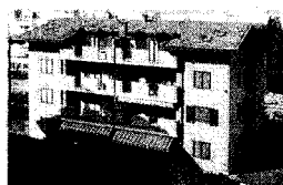
CASSANO D'ADDA, via C. Colombo

residenza "La Palasina" * bilocale * trilocale