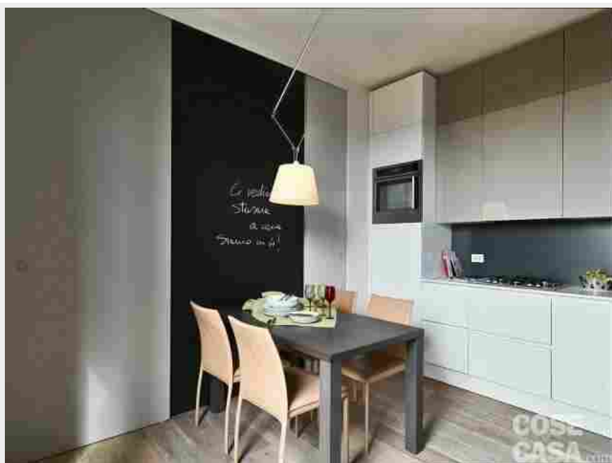
Cucina soggiorno di un bilocale (progetto arch. Tommaso Giunchi). Vuoi vedere l'intera casa? Clicca qui!

Inoltre, non può avere accesso diretto a un bagno, ma deve essere separata da un disimpegno o antibagno. E devono essere presenti una canna di esalazione dei fumi di cottura sfociente sul tetto, con relativa cappa aspirante (solo filtrante se si hanno i piani a induzione), e un foro grigliato di ventilazione a non oltre 30 cm dal pavimento, per il ricambio dell'aria combusta dai fuochi.