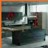
Cucine a tinte scure