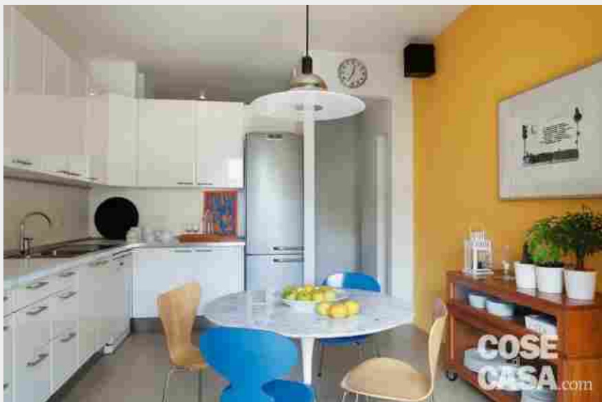
con cucina abitabile a L con zona pranzo centrale e mobile in legno che "scalda" l'ambiente. Clicca qui per vedere l'intera casa, progetto Studio Costa Zanibelli Associati.

sia lungo i piani di lavoro, prevedendo uno spazio adeguato per l'apertura di cassetti, sportelli forno, frigorifero e lavastoviglie, contenitori estraibili.