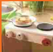
Cucine in miniatura per bambini per giocare a Masterchef