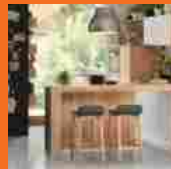
Cucina piccola: per chi ha poco spazio o per chi sta poco ai fornelli