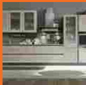
Per la cucina un piano di lavoro resistente e facile da pulire