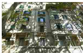
Compravendite immobiliari: prezzi delle abitazioni in netto calo