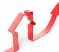
Immobiliare: cresce la domanda di abitazioni nei primi nove mesi del 2016