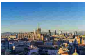
Prezzi abitazioni terzo trimestre 2016 -0,9%