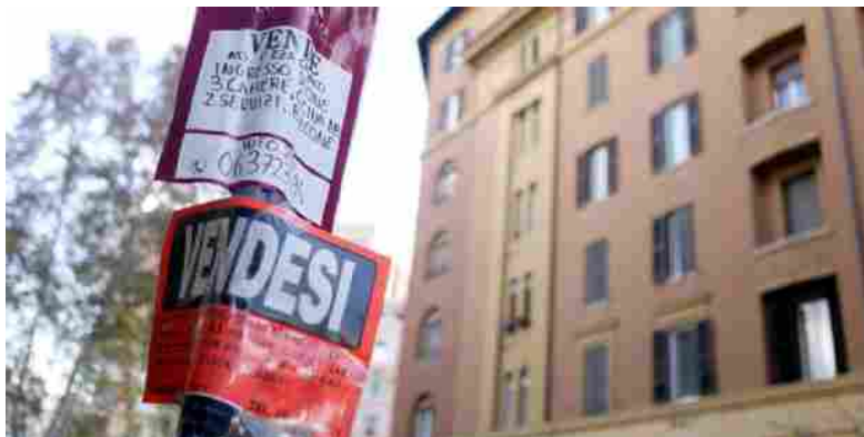
Segnali di ripresa nel mercato immobiliare.

Stampa ROMA - Nel quarto trimestre del 2015 è proseguito il graduale miglioramento del mercato immobiliare e la quota di agenti che segnala un calo dei prezzi di vendita delle abitazioni ha continuato a ridursi, risultando minoritaria per la prima volta dalla primavera del 2011. E' quanto emerge dal sondaggio condotto da Bankitalia, Tecnoborsa e Agenzia delle Entrate.