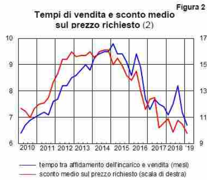
(1) Saldo tra le percentuali di risposte "in aumento" e "in diminuzione"; (2) gli sconti medi sul prezzo sono indicati in punti percentuali.

Tecnoborsa | Dati dell'indagine agenzie immobiliari.